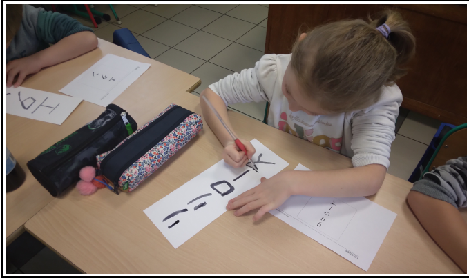
Ecriture de son prénom en katakana

Elle consiste dans un premier temps, par l'exploration de différents symboles représentatifs du pays: le drapeau, les cerisiers, l'uniforme scolaire, le mont Fuji, les manga & anime, etc.